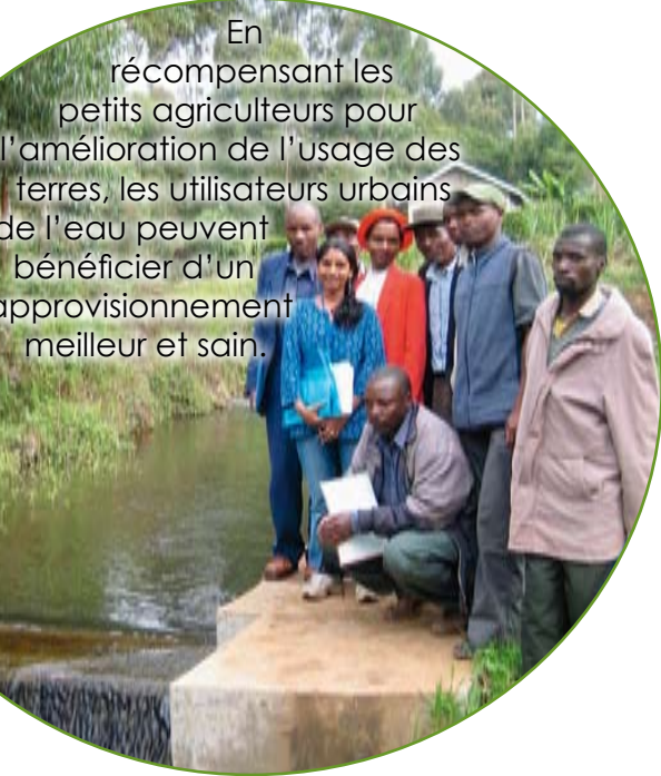
En récompensant les petits agriculteurs pour l'amélioration de l'usage des terres, les utilisateurs urbains de l'eau peuvent bénéficier d'un approvisionnement meilleur et sain.

Des centaines de milliers de petits producteurs et de personnes vivant dans les hauts plateaux de l'Afrique de l'Est et de l'Ouest bénéficieront d'accords équitables et efficaces entre les conservateurs communautaires et les bénéficiaires des services des écosystèmes