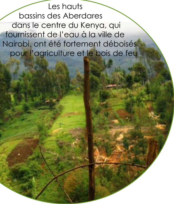
Les hauts bassins des Aberdares dans le centre du Kenya, qui fournissent de l'eau à la ville de Nairobi, ont été fortement déboisés pour l'agriculture et le bois de feu

EN AFRIQUE RURALE, les conditions de survie des communautés pauvres reposent en grande partie sur la viabilité des écosystèmes qui fournissent nourriture et eau potable. Ces services écosystémiques profitent également aux consommateurs d'eau des zones urbaines industrielles alentours ainsi qu'aux communautés établies en zones fortement inondables. La durabilité de ces écosystèmes implique également l'intérêt des personnes appréciant la biodiversité luxuriante de l'Afrique comme les touristes ou les organisations locales et internationales impliquées dans la séquestration du carbone. Pourtant, la dégradation de ces écosystèmes ne cessent de progresser car les prises de décisions sur des problèmes comme l'utilisation des terres et la déforestation sont insuffisantes, elles impliqueraient des surcoûts et des risques supplémentaires pour les communautés rurales et urbaines.